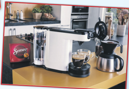
Abb. ähnlich, ohne Deka

Kanne Filterkaffee oder Tasse Kaffee? Senseo Switch kann einfach beides. Einzigartige 2-in-1 Brühtechnologie (Schwallbrühverfahren & patentierte Senseo Brühtechnologie) Edelstahl Thermoskanne, Wassertank: 1 Liter Padkaffee: 1 oder 2 Tassen Lieferumfang: 2 Padhalter (1 oder 2 Pads), Thermoskanne, Abtropfschale - Farbe weiß - Leistung: 1.450 Watt