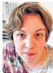
Von Franziska Feuerstack-Zick Allianz-Genervertretung Osterwieck

Nicht nur die Leistungen aus der gesetzlichen Rentenversicherung werden aufgrund des demographischen Wandels weiter schrumpfen – auch im Gesundheitswesen müssen gesetzlich Krankenversicherte mit Leistungskürzungen rechnen. Im Gegenzug werden die betriebliche Altersvorsorge und die betriebliche Krankenversicherung immer attraktiver.