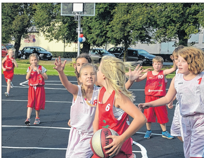
Anlässlich der Osterwiecker Sportwoche ist auf dem Anger ein Basketball-Freiplatz eingeweiht worden.

Um eine Wiederaansteckung zu vermeiden, sollten Sie die Wäsche von betroffenen Personen bei 60 Grad waschen und Stofftiere für drei Tage in eine luftdichte Tüte geben.