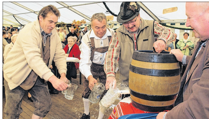
„O'zapft is“ heißt es beim Hoppenstedter Oktoberfest am 7. Oktober.

14-18 Uhr „Zur alten Tischlerei“, Ausstellung mit Taschen, Koffer, Tücher, schals