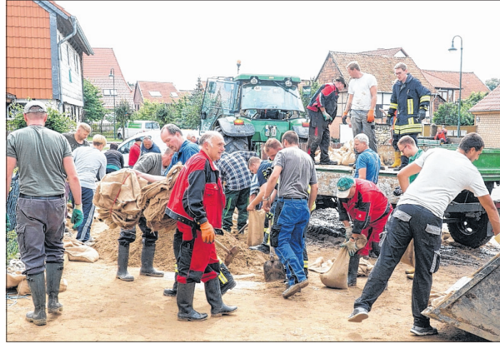
In Berßel füllten Feuerwehr, Bauhof und Einwohner gemeinsam Sandsäcke zum Schutz vor den Ilse-Fluten.

Es folgten Analysen des Geschehens, die mit Entscheidungen der Verantwortlichen einhergehen. Nach dem Ereignis ist vor dem Ereignis.