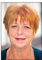
Von Irene Feuerstack Allianz-Generalsvertretung Osterwieck

Lange vor Reiseantritt freut man sich auf den Urlaub, will sich entspannen, Energie tanken und etwas erleben. Doch es kann ganz anders kommen.