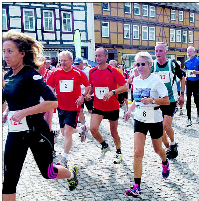
Unter Nachwuchsmangel leidet auch der seit 2002 eigenständig bestehende Verein Laufgemeinschaft Osterwieck. Voriges Jahr organisierte er zum 15. Mal den Fallstein-Lauf, der anlässlich des Lutherfestes sogar auf dem Marktplatz gestartet wurde. Der Verein beteiligt sich auch an dem Vereinstag – in der Hoffnung, den einen oder anderen der eigentlich recht zahlreich vorhandenen Läufer aus der Stadt zum gemeinsamen Training und andere gemeinschaftliche Lauferlebnisse gewinnen zu können. Dazu sollen Lauftreffs mittwochs und sonntags angeboten werden. Über Details wollen Vereinsmitglieder am 10. März im E-Werk informieren.

Weitere Informationen zum Vereinstag stehen im Internet auf www.vision20plus.de . Die Organisatoren sind erreichbar montags bis freitags von 8 bis 12 Uhr unter Telefon (039421) 793-222 oder per Mail vereine@stadt-osterwieck.de .