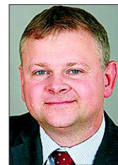
Von Ralf Döppelheuer ÖSA-Agenturleiter in Osterwieck

Grünes Mopedschild sorgt für Haftpflichtschutz