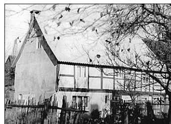
Das Haus Kattentor 114 in den 1960er Jahren und in jüngerer Zeit.