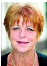
Von Irene Feuerstack Allianz-General- vertretung Osterwieck

letzt, ist die Berufsgenossenschaft zuständig. Sie übernimmt u. a. Heilkosten und zahlt bei schweren Dauerschäden gegebenenfalls eine Rente.