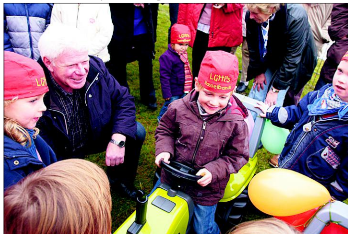
Die Knirpse im Vordergrund, die mit Stolz den Namen von „Lüttis Rasselbande“ auf dem Kopf tragen, sind jetzt schon in der Schule. 2008, zum 1. Geburtstag der neuen Kita, erlebten sie die Namensweihe.

LÜTTGENRODE. Vor fünf Jahren, im November 2007, zogen die kleinsten Einwohner aus der Gemeinde Lüttgenrode in die neue Kindertagesstätte „Lüttis Rasselbande“ in die Schulstraße 12a ein.