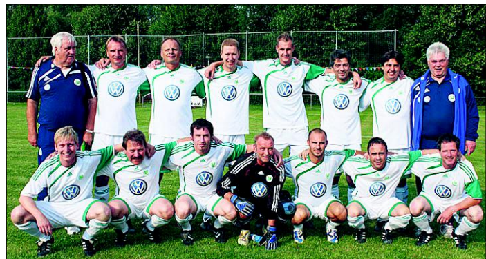
Die Traditionsmannschaft des VfL Wolfsburg trat 2011 schon mal auf dem Sportplatz in Zilly an. Damals feierte der TSV sein 100-jähriges Bestehen.