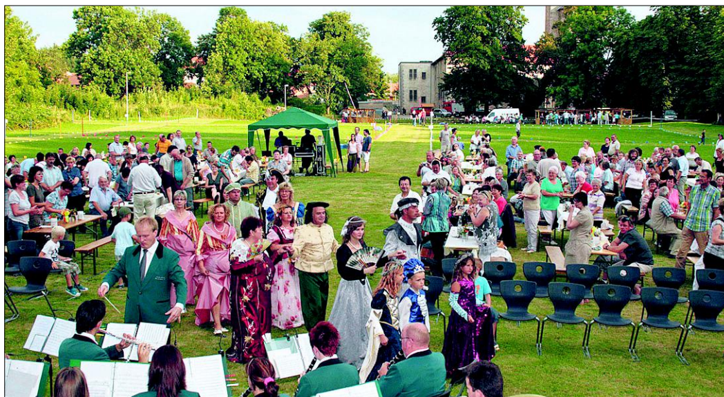
Die Hessener Gartennacht wird am 14. Juli den Schlosspark in herzogliche Zeiten verwandeln.

14.30 Uhr Kirche, „Veltheim liest“ zum Thema: „Von Plattdeutsch bis Neudeutsch – Geschichten, die das Leben schreibt“