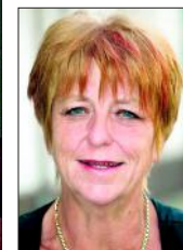
Von Irene Feuerstack Allianz-Generalvertretung Osterwieck