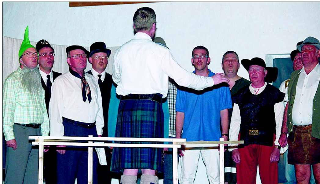
Immer zu Spaß aufgelegt ist der Berßeler Männerchor. Hier bei seiner Musicalaufführung 2010.

„Wir können nur hoffen, dass das Wetter mitspielt und dass vie-