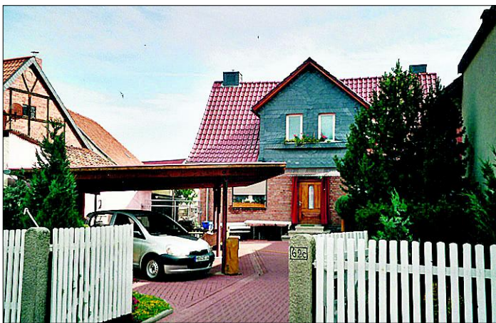
Das Wohnhaus 62c heute in der Eisernen Straße