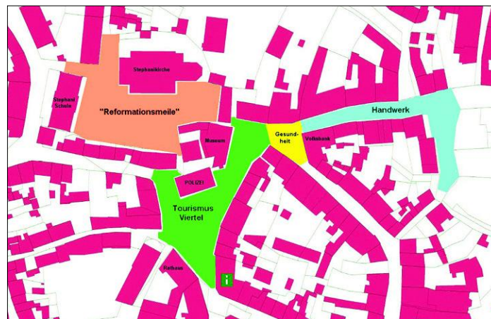
Plan des Festgebietes, in dem die Veranstaltungen stattfinden.