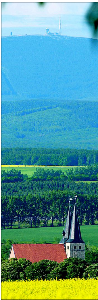
Die Stephanikirche am Fuße des Brockens. Das Lutherfest soll die Region nach Osterwieck führen.

Zwischen 1552 und 1557 verwirklichten die Osterwiecker ihren Plan, die alte romanische Kirche im neuen Geist der Reformation umzubauen. Sie rissen das frühere Kirchenschiff ab – allein der romanische Westbau mit den Doppeltürmen blieb bestehen – und schufen das erste Dokument eines Kirchneubaus in der Epoche der Reformation. Zahlreich sind die Hauszeichen (Wappen) der Osterwiecker Familien und Gilden in der Kirche. Sie stehen für den Zusammenhalt der Bürgerschaft. Heute erinnert das regionale Epochenfest der Reformation „Mit Luther in die neue Zeit“ an genau diesen Zeitgeist der Reformation in Osterwieck: Mit Mut und Zusammenhalt nicht nur das Fest zu meistern, sondern auch die eigene Zeit.