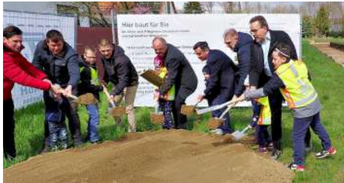
Symbolischer Start auf dem Baufeld für 18 barrierefreie Wohnungen und eine Tagespflegeeinrichtung durch Vertreter von Investor, Landkreis und Kommune.

Dardesheim. Denn es ging an dem Tag nach Ostern wirklich los mit dem Bau von 18 barrierefreien Wohnungen und einer Tagespflegeeinrichtung in Dardesheim. Nachdem zuvor schon ein anderer Trupp nach archäologischen Funden gegraben hatte. Die Dardesheimer hoffen seit langem auf eine barrierefreie Seniorenwohn- und Betreuungseinrichtung in ihrem