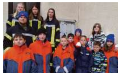
Die Jugendfeuerwehr Bühne/Rimbeck