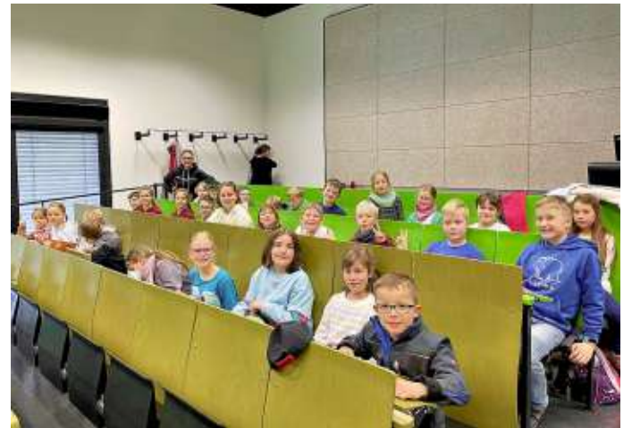
Sie lauschen einem Streifzug durch die Geschichte des Kinderbuchs

Kürzlich konnten 27 Kinder der Einheitsgemeinde Stadt Osterwieck zwischen acht und zwölf Jahren mit dem Bildungsbus des Energieberatungszentrums (EBZ) zur Kinderhochschule nach Wernigerode fahren.