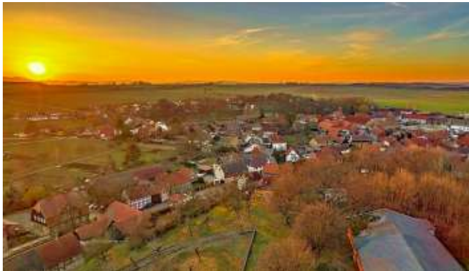
Abendlicher Blick über Schauen, im Vordergrund der Wahrberg mit seinem Schützenzelt, am Pfingstweekenende das Festzentrum der 1050-Jahr-Feier.

17 Uhr (Park) Eröffnung der 1050-Jahr-Feier mit anschließender Baumpflanzaktion der Schauener Kinder im Park, Sonderstempel der Harzer Wandernadel und eine 1050-Jahr-Feier-Zeitkapsel (wäh-