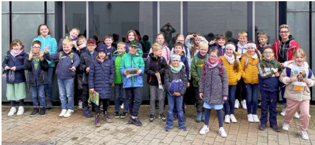
27 Osterwiecker Kinder nehmen an Vorlesung der Hochschule Harz teil

27 Kinder fahren mit dem Bildungsbus zur Kinderhochschule nach Wernigerode