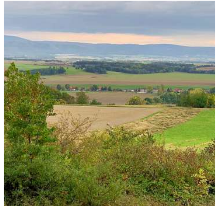
Die Wanderung umfasst sechs Kilometer und verläuft größtenteils flach.

Kleiner Fallstein. Im Herbst zeigt sich ein wahres Farbspektakel im Kleinen Fallstein. Dazu bietet sich die Grenzturm-Runde ideal an. Neben den vielfältigen Landschaftsformen, weite Ausichten und unterschiedliche Wegetypen, erleben Sie genau dieses Schauspiel. Zudem besitzt der Rundweg durch das Erlebnis der ehemaligen deutsch-deutschen Grenze und den Informationen am Grenzturm eine zusätzliche historische Komponente, so dass Körper und Geist bei dieser Wanderung gleichermaßen angesprochen werden. Bis auf den steilen Auf- bzw. Abstieg an der Waldgaststätte „Willeckes Lust“ gibt es nur geringe Anforderungen. Beide Bundesländer, Nieder-