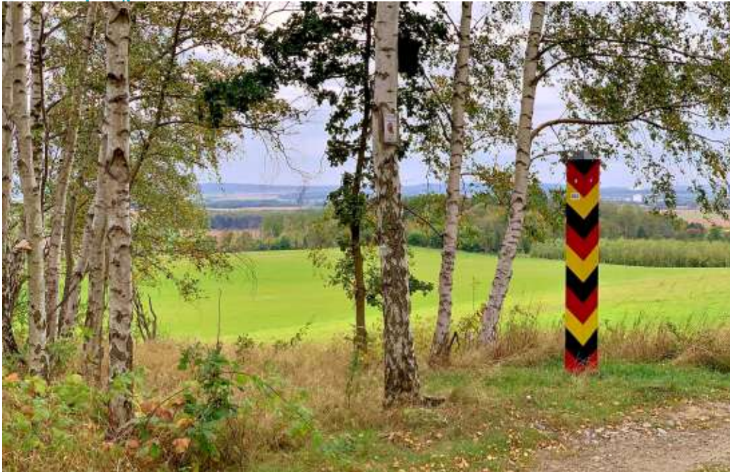
Die Grenzturm-Runde verbindet die Bundesländer Niedersachsen und Sachsen-Anhalt.

Eine Wanderung für Körper und Geist zwischen den Ländern