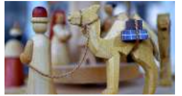
Das Michaeliskloster stellt Alternativen zum klassischen Krippenspiel vor."

Was können wir jetzt tun? Im Zoom-Workshop berät das Michaeliskloster Hildesheim und spricht über Alternativen: vom Outdoor-Gottesdienst und Hörspielproduktion über Krippenspielstationen bis hin zur Outdoorrippe. Das Michaeliskloster Hildesheim, das Zentrum für Gottes-