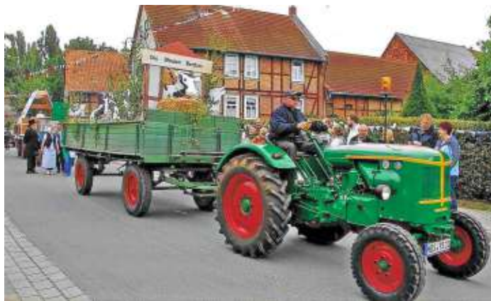
Von den Berßler Blinden, die erst ab 9 Uhr richtig sehen können, handelt eine Überlieferung.

Sie schickten ihren Kuhhirten unter einem Vorwand ins Dorf und trieben die Herde voller Schadenfreude nach Berßel. In der Meinung, die Osterwiecker Kühe mitzuführen. Sie hatten in ihrem Eifer und wegen