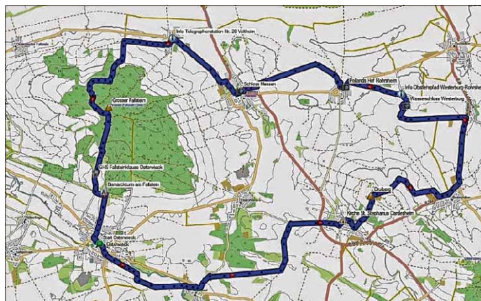
Mehrere Stunden dauert die Radtour von Osterwieck über Dardesheim bis Veltheim und zurück nach Osterwieck. Der Schwierigkeitsgrad dieser Tour beträgt „mittel“.