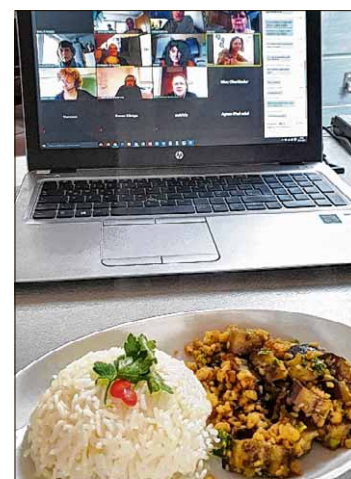
Kochen vorm Laptop.

Anmelden kann man sich bei der Kreisvolkshochschule Harz ( www.KVHS-Harz.de ). Mit der Anmeldung wird ein Link mit einem Zoom-Zugang sowie dem Beitrittscode für die Lernplattform der Volkshochschulen (vhs.cloud) verschickt. Teilnehmende benötigen lediglich eine stabile Internetverbindung, einen Computer mit Kamera und Mikro oder alternativ ein Tablet oder ein Smartphone. Auch eine Einkaufsliste für die notwendigen Zutaten gibt es.