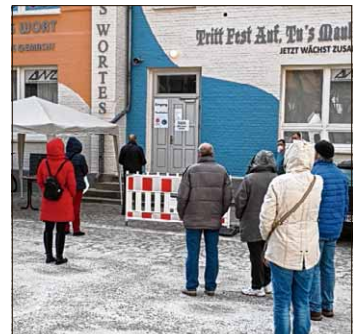
Noch am 31. März und am 2. April können sich Osterwiecker kostenlos testen lassen.