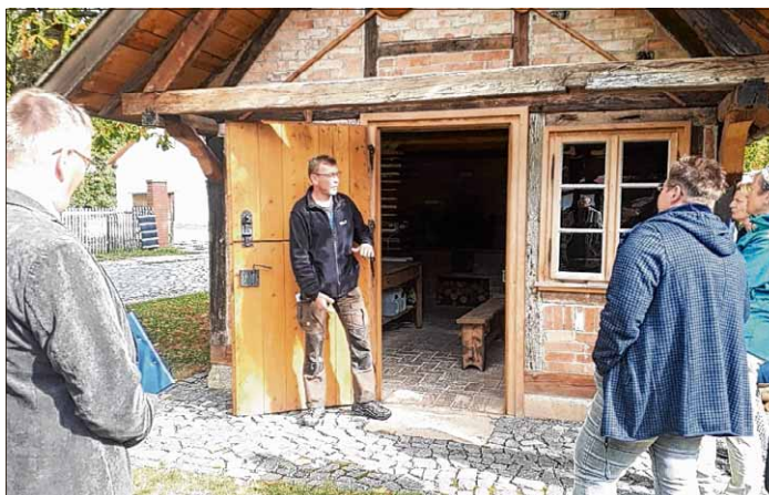
Die Jury vor dem Backhaus in Wülperode.

Es ist doch etwas Aufwand damit verbunden, an dem Wettbewerb teilzunehmen. Viel Papier sowie ein längerer Ortsrundgang mit der Jury. Dieser fand vergangenen September statt. Doch für die Orte hat sich allein schon die Teilnahme gelohnt. So wurden Götterode, Suderode, Wülperode, Hessen, Zilly und Veltheim vom Land Sachsen-Anhalt mit jeweils 700 Euro belohnt.