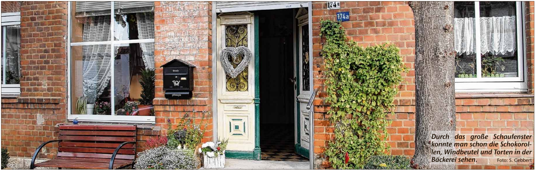
Durch das große Schaufenster konnte man schon die Schokorollen, Windbeutel und Torten in der Bäckerei sehen.