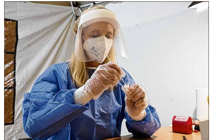
Antigen-Schnelltests können nur durch geschultes Personal durchgeführt werden. Dafür wird ähnlich wie beim PCR-Test ein Nasen- oder Rachenabstrich gemacht. Die Auswertung erfolgt direkt vor Ort.

Dieses Testangebot gilt für die Tage 22.3., 24.3., 26.3., 29.3., 31.3. und 2.4. jeweils von 16 Uhr bis 18 Uhr. Kinder unter 14 Jahren können nur am 24.3. und 31.3. getestet werden. Anmeldungen sind nicht notwendig. Mitzubringen sind der Personalausweis, die Chipkarte der Krankenkasse und es gilt Mundschutzpflicht. Anspruch auf den wöchentlichen kostenlosen Test haben nur Bürgerinnen und Bürger, die ihren Hauptwohnsitz in den Orten der Einheitsgemeinde haben.