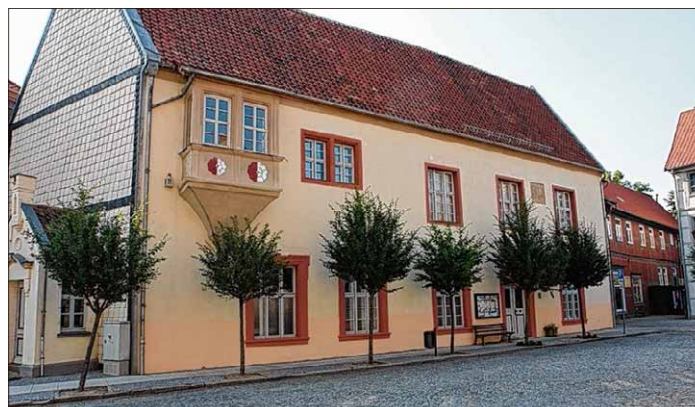
Das Heimatmuseum am Marktplatz befindet sich im ältesten Haus Osterwiecks. Es wurde erstmals 1265 erwähnt.