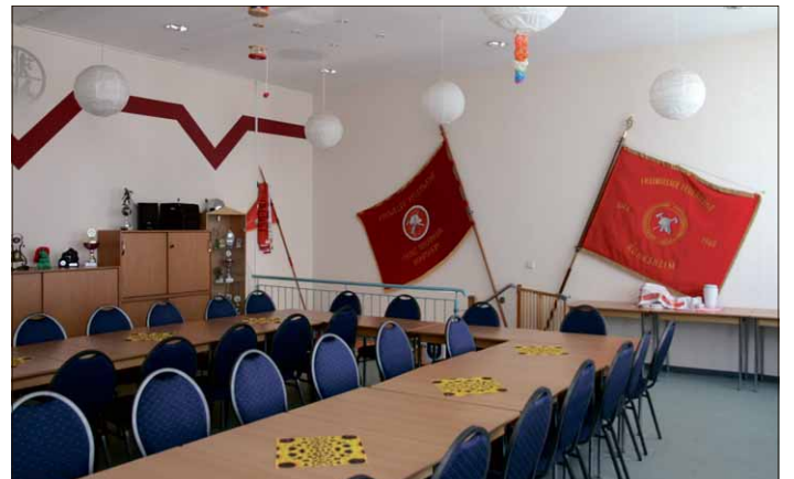
Die Kameraden treffen sich normalerweise jeden zweiten Mittwoch.

Darum ist die Feuerwehr für unseren Ort so wichtig: Weil wir den Zusammenhalt der Gemeinde Rohrsheim unterstützen. Egal welcher Verein oder Anwohner aus Rohrsheim unsere Unterstützung benötigt, helfen wir gern, wenn es möglich ist. Des Weiteren veranstalten wir jedes Jahr die Braunkohlwanderung, das Maifeuer und den Fackelumzug.