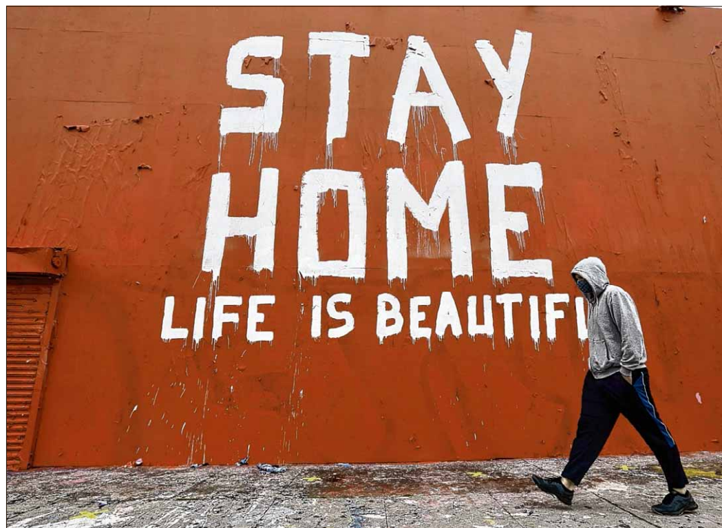
„Bleib zu Hause. Das Leben ist schön“ steht übersetzt an einer Hauswand in den USA. Auch in Deutschland war die Botschaft vielerorts zu lesen.

Unsere Schule arbeitet jetzt mit der digitalen Lernplattform „Moodle“. So können wir mit den Schülern im digitalen Homeoffice arbeiten und ihnen darüber Material und Aufgaben bereitstellen. Obwohl solche Plattformen schon länger in Gebrauch sind, tun sich viele Lehrer aufgrund ihres Alters schwer. Jetzt aber mussten alle Lehrer nach einhalb Stunden Crashkurs damit arbeiten. Aber der pädagogische Erfolg ist nicht mess- oder sichtbar. Ob ein Schüler überhaupt und wie er damit arbeitet bleibt unkontrollierbar. Auch die Voraussetzungen wie die technische Ausstattung, Internet oder Hilfe sind in den Elternhäusern oft sehr unterschiedlich. Und das Allerwichtigste: Der Lehrer-Schüler-Kontakt fehlt.