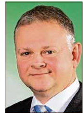
Von Ralf Döppelheuer ÖSA-Agenturleiter in Osterwieck