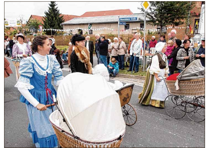
Rückblicke auf das frühere Leben der Berßeler brachte auch der Festumzug der 1000-Jahr-Feier vor sechs Jahren.